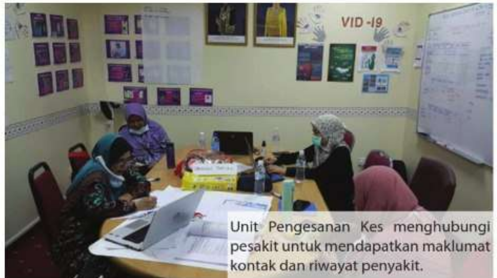
Unit Pengesanan Kes menghubungi pesakit untuk mendapatkan maklumat kontak dan riwayat penyakit.

Sebaik sahaja kemasukan kes positif COVID-19 dimaklumkan kepada Bilik Gerakan HCTM, sama ada maklumat diterima dari Pakar Perubatan Penyakit Berjangkit ( ID Physician ) ataupun Pegawai Perubatan dari Pejabat Kesihatan Daerah, Unit Pengesanan Kes akan diaktifkan.