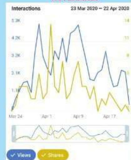
Perbandingan siri masa jumlah ahli melihat (Views) dan berkongsi maklumat Telegram (Shares) Bilik Gerakan Covid-19 HCTM